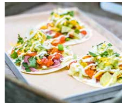
Soft Taco Avocado