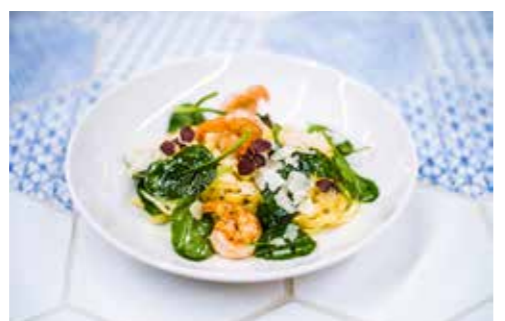
× PASTA LIMONI ×