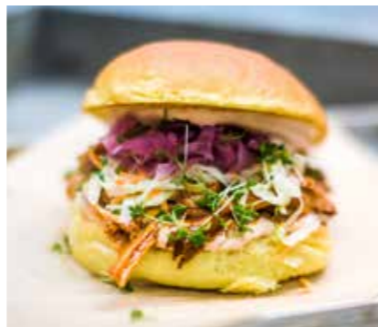
Pulled Pork Burger